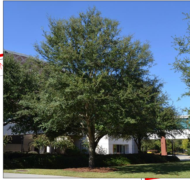
Encino siempre verde (SV) Quercus virginiana