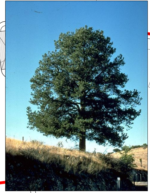
Pino Piñonero (PP) Pinus cemboides